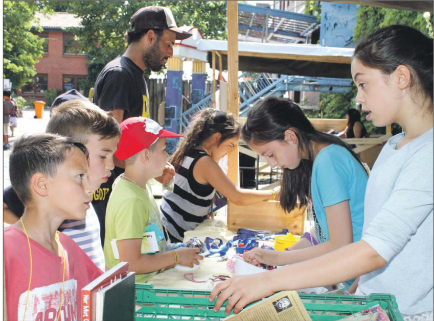
Schlussverkauf: Im Kiosk brachten die Kinder ihre letzten Sprotten unter die Leute.